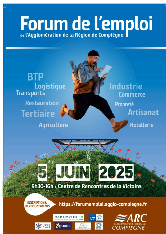
FORUM DE L'EMPLOI - 07/06