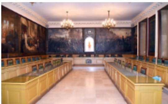
CONSEIL MUNICIPAL - 04/07 et 11/07