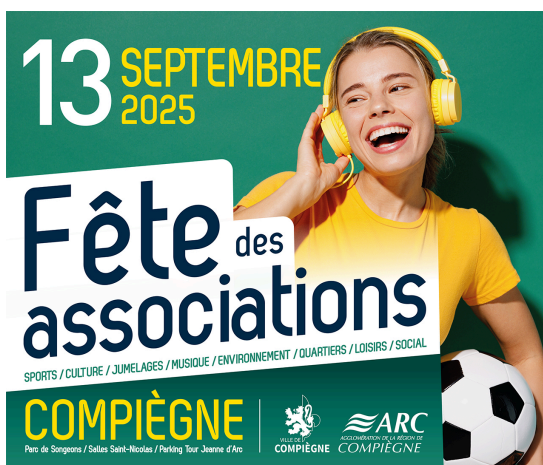
FÊTE DES ASSOCIATIONS - 13/09