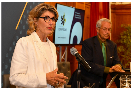
8EME SEMINAIRE DES COMMERÇANTS - 16/09