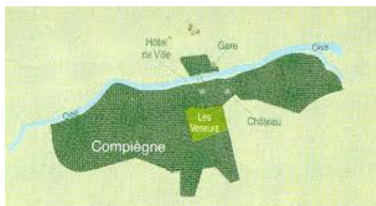
REUNION DE QUARTIER LES VENEURS - 16/10