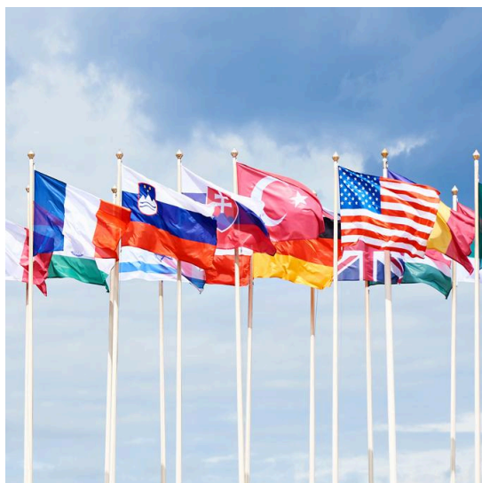
JOUR DES JUMELAGES - 05/10