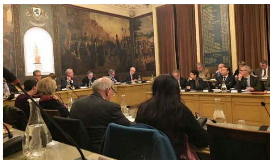
CONSEIL D'AGGLOMERATION - 14/10